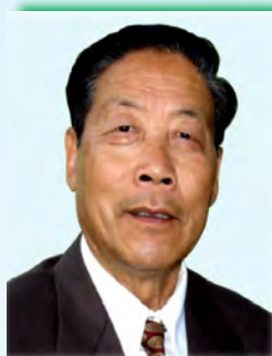
台励 中医师 各种疑难杂症

全美最权威的 中医专家群体队伍! 我们训练有素, 我们拥有爱心, 我们解除您的病痛!