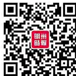
(新闻来自各大新闻媒体,并不代表本报立场)