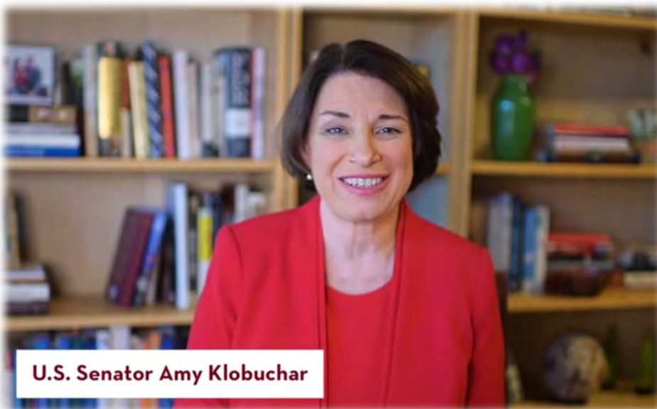
U.S. Senator Amy Klobuchar