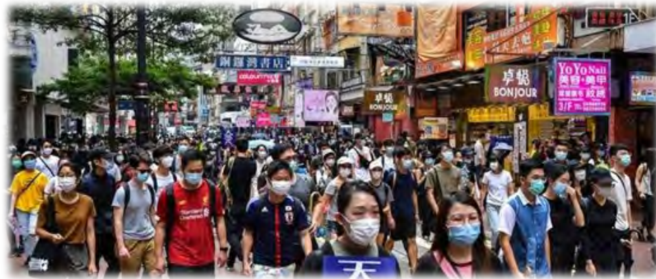
(5月24日，数万香港市民再次走上街头，游行抗议中国人大早前提出的“港版国安法”草案)

6. 授权全国人民代表大会常务委员会就建立健全香港特别行政区维护国家安全的法律制度和执行机制制定相关法律，