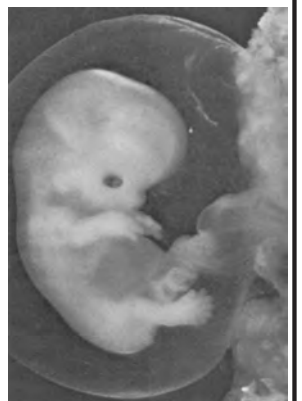
六個星期胎兒的照片

Yifan Fund Pro-Life Action Ministries (有中文翻譯)